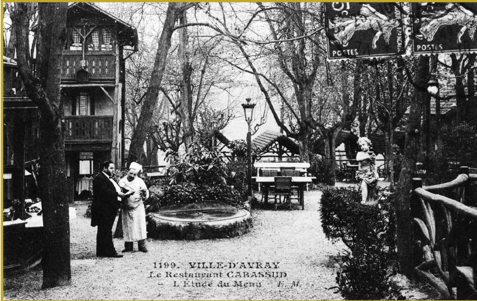
Carte Postale, 1910 - Le Restaurant Cabassud, L'Etude du Menu