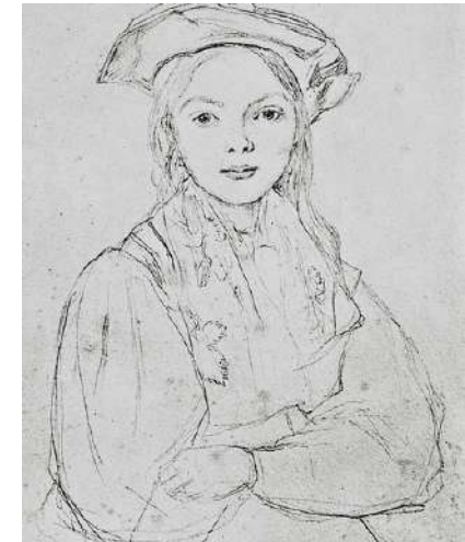
Corot - Portrait d'une jeune fille coiffée d'un béret.