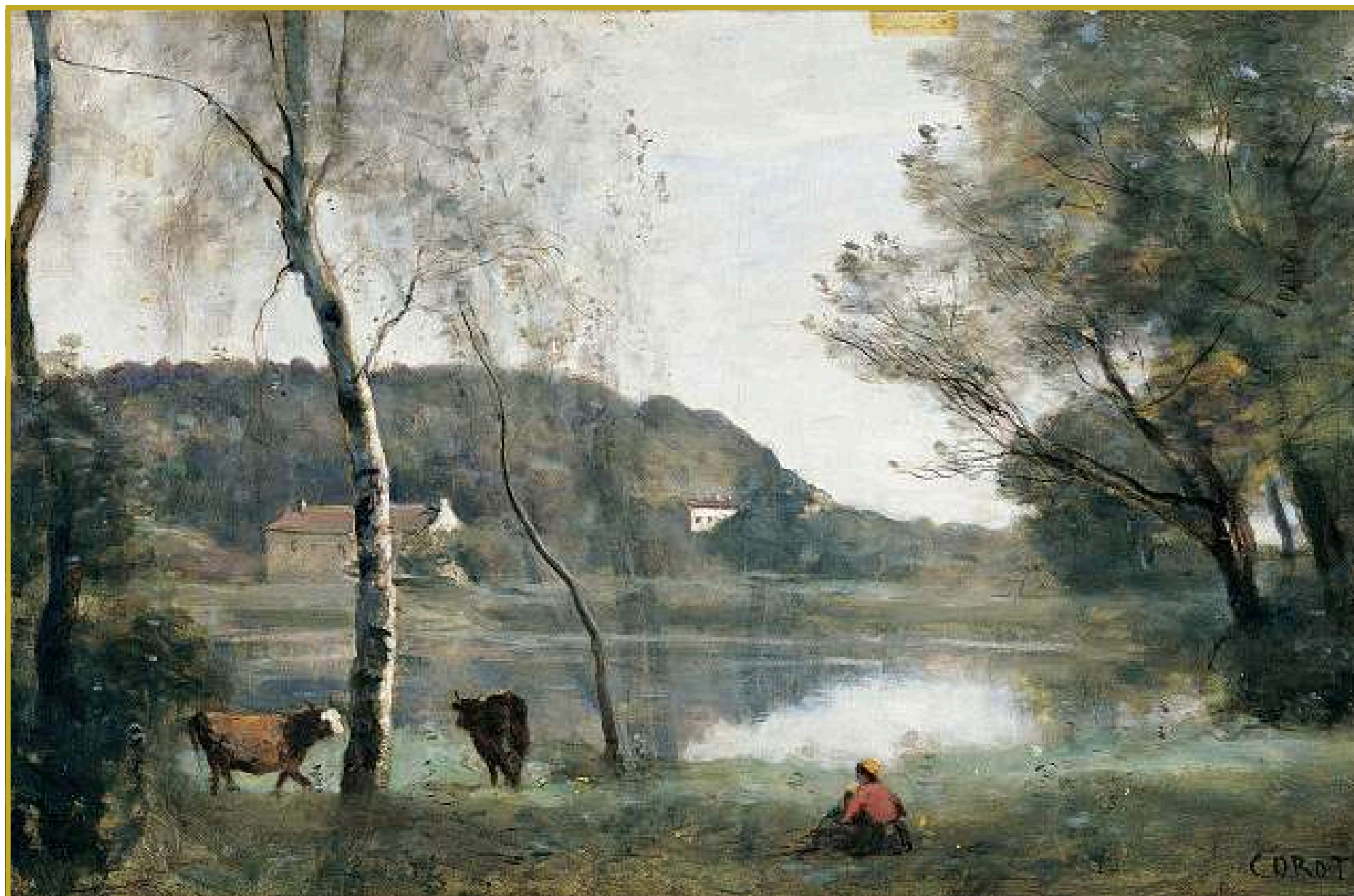
Corot - Deux vaches près d'un bouleau en vue de l'étang