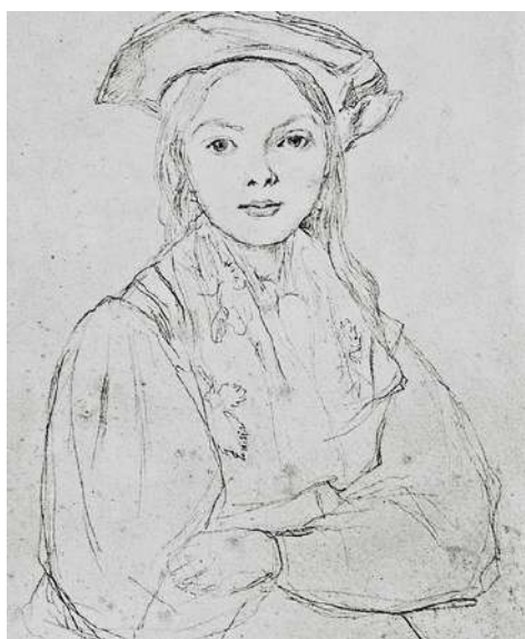
Corot - Portrait d'une jeune fille coiffée d'un béret.