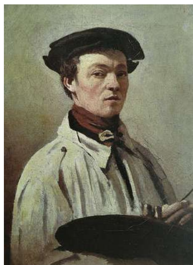
Corot - Autoportrait

3221 C'EST LE NOMBRE DE TABLEAUX, DESSINS ET GRAVURES RÉALISÉS PAR COROT